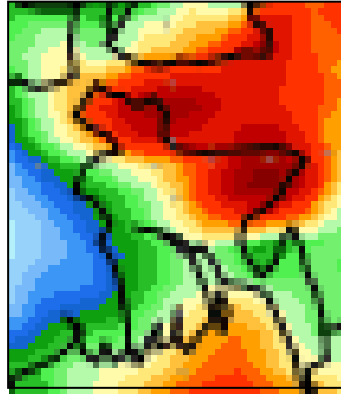
Extended Outlook for accumulative rain (08-06-2014 to 14-06-2014)